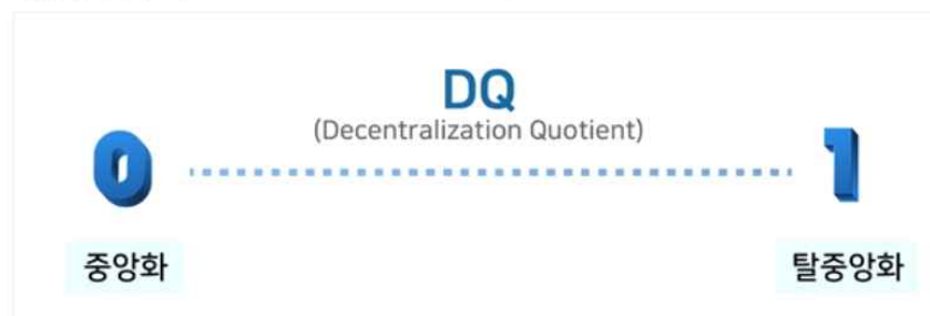
탈중앙지수(DQ, Decentralization Quotient)

탈중앙지수의 범위는 0에서 1까지다. 완전한 중앙화는 0, 완전한 탈중앙화는 1이다. 블록체인 탈중앙화 정도를 측정해 탈중앙지수를 산출하는 방법에는 다양한 제안들(지니계수를 사용한 측정, 노드 집중도를 이용한 측정 등)이 있는데 아직 명확한 가이드라인은 없는 상태다. 하지만, 탈중앙지수를 블록체인 평가 척도에 포함하려는 노력은 블록체인 본연의 목적을 달성하기 위한 건전한 움직임으로 볼 수 있다.