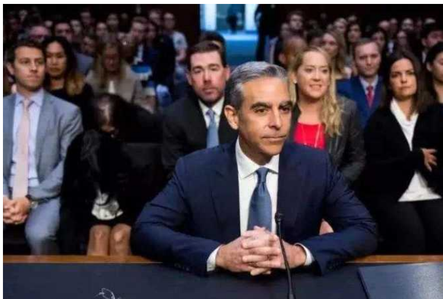
데이비드 마커스 : 現 페이스북 리브라 프로젝트 총괄

미국 소비자 단체 퍼블릭 시티즌의 의장인 로버트 와이스먼(Robert Weissman) 또한 “페이스북처럼 전 세계적으로 20억 사용자를 보유한 기업은 유일무이하다”며 “리브라 협회는 이미 사회적으로 상당한 영향력을 갖고 있으며, 독점적 카르텔 형성 여건을 갖췄다. 리브라가 페이스북을 바탕으로 영향력을 확장한다면 돌이킬 수 없는 거대한 ‘감시 기업’ 이 탄생할 수도 있다”고 경고했다.